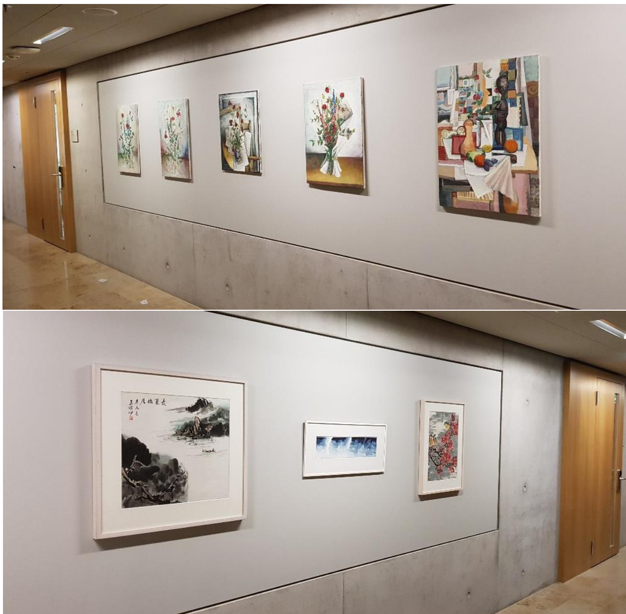
Abbildungen 8 bis 13 ausgestellte Kunstwerke an der FHS St. Gallen OST